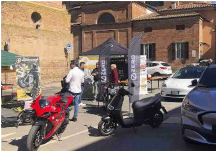
L'evento è in programma domenica al Centro Ca' Nova